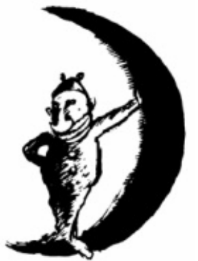
Kulturnatten i Uppsala