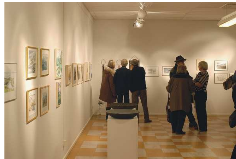
Gottsunda bibliotek fungerade under många år som huvudsaklig utställningslokal